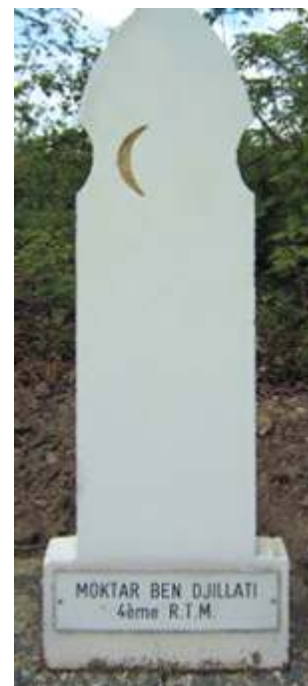
De graven van beide Marokkanen op de begraafplaats van Kapelle in Zeeland

bodem bij Kapelle voor de verdediging van Zuid-Beveland en Walcheren. Zeeland deed op dat moment '(nog) niet mee' met de algehele Nederlandse kapitulatie van 14 mei 1940.