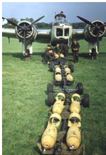
Het laden van 250 lb. bommen in een Bristol Blenheim